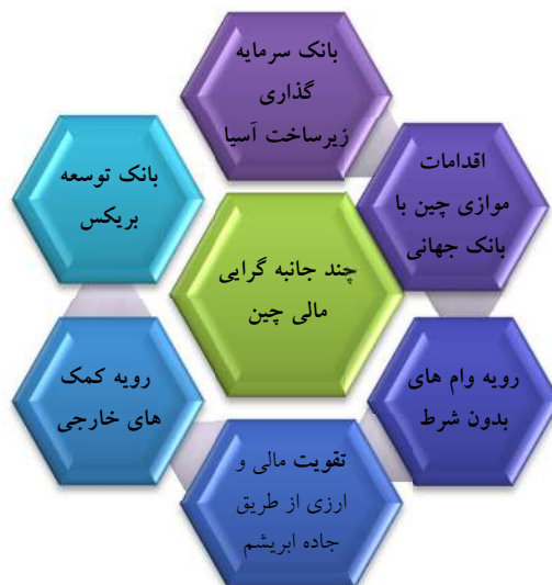
شکل ۱. ایجاد چندجانبه‌گرایی مالی چین بیرون از نظم مالی برتن وودز

ابتکار چندجانبه‌گرایی مالی چین و چالش نظم مالی بین‌المللی ... (سیدسعید میرترابی و دیگران) ۳۹۳