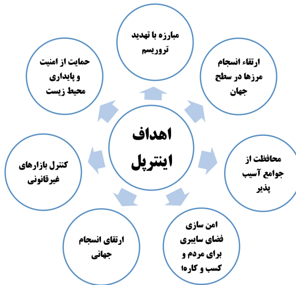
شکل ۱. اهداف سازمان اینترپل (گزارش سازمان اینترپل ۲۰۱۷)

۲. تأسیس و توسعه کلیه مؤسسه‌هایی که جهت پیشگیری از وقوع جرایم عمومی ضروری است.