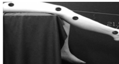
شکل ۲. اندازه‌گیری زاویه ۳۰ درجه مفصل زانو

انجام تصویربرداری در این آزمون از دوربین دیجیتال مدل Canon IXY 21015 ساخت ژاپن استفاد شد، پس از آن تصاویر به رایانه منتقل و توسط نرم افزار اتوکد ۲۰۰۹ گونیامتری شد. مقایسه مقادیر در دو حالت تست و پاسخ، میزان خطا را مشخص می‌سازد. در این مطالعه زاویه ۳۰ درجه زانو به عنوان زاویه هدف برای بازسازی انتخاب شد، زمان استراحت بین هر ست یک دقیقه بود آزمون برای هر آزمودنی سه بار تکرار شد. میانگین خطای بازسازی زاویه طی سه بار اندازه‌گیری، خطای بازسازی زاویه برای آن زاویه بود (شکل ۲).