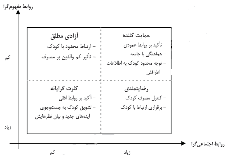
نمودار ۱. الگوهای برقراری ارتباط در خانواده (مک لود و چافی، ۱۹۷۲)

نیات رفتاری خرید. نظریه عمل منطقی ۱ (TRA) به‌طور گسترده به‌عنوان یک اساس برای پیش‌بینی نیات رفتاری و یا رفتارهایی استفاده شده است. علاوه بر این نیات رفتاری از نظریه عمل منطقی، ارائه شده توسط مهتا (۱۹۹۴)، الگویی است که نیات رفتاری (مانند علاقه به خرید و یا انگیزه های خرید) را تبیین می‌کند و در واقع متغیری مناسب برای اندازه‌گیری اثربخشی راهبردهای تبلیغاتی است (مهتا، ۱۹۹۴). علاوه بر این، زیتامل (۱۹۸۸)، پیشنهاد کرده است که متغیرهای نیات رفتاری مشتری بهترین نشانه رضایت مشتری و کیفیت خدمات کسب‌وکار است که به‌وسیله چهار آیتم توصیه به دیگران، اظهارات مثبت، تکرار خرید و مراجعه دوباره اندازه‌گیری می‌شوند (بیگنه و همکاران، ۲۰۰۵).