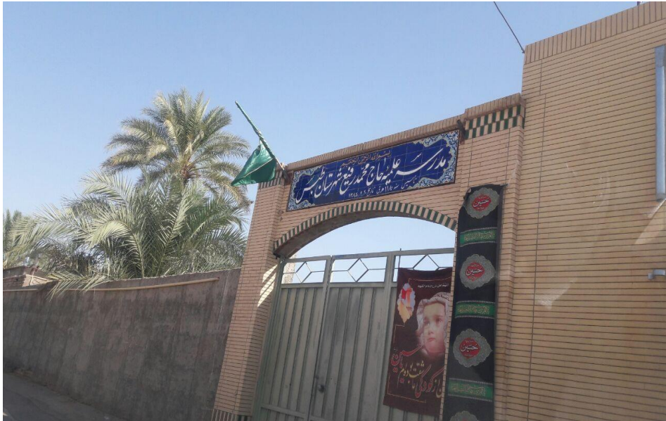
تصویر ۲) سردر ورودی مدرسه