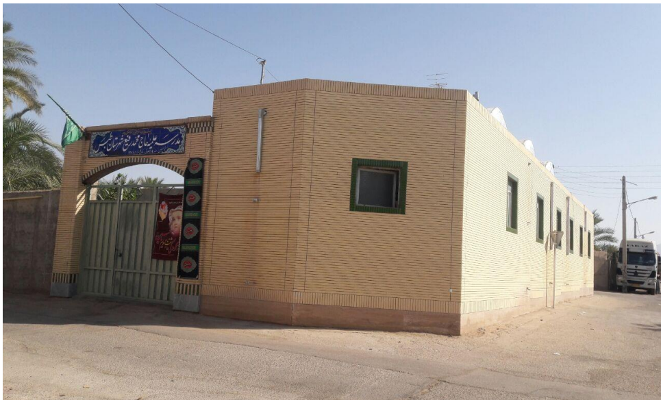
تصویر ۳) نمایی از بیرون مدرسه