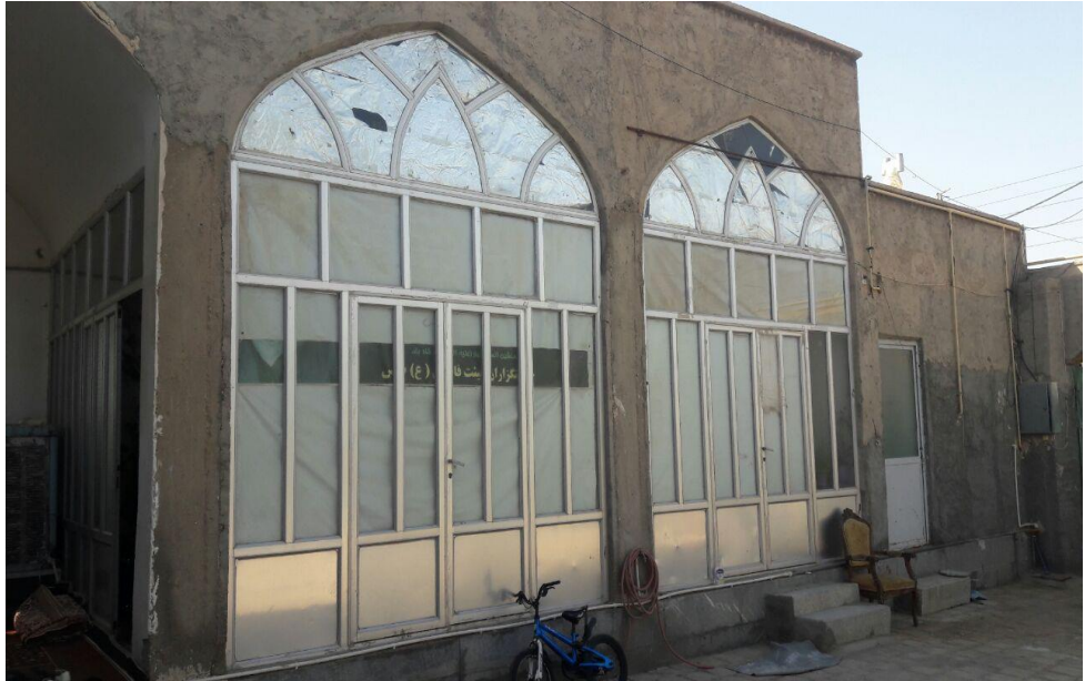
تصویر ۴) نمایی از داخل مدرسه