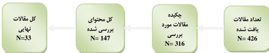
شکل ۱. نتایج جستجو و انتخاب مقاله‌ها

ملاک ورود به متون مناسب، شامل پژوهش‌های چاپ شده مرتبط با مدیریت استعداد بود که اطلاعات کافی را در مورد تحقیق گزارش کرده باشند. ملاک خروج متون نیز هر گونه منبع علمی بی ارتباط با سؤال تحقیق بود. در نهایت، ۲۰۶ مقاله گردآوری شد. با مطالعه عنوان تحقیق، چکیده و محتوای مقاله‌ها مواردی که با موضوع و سؤال تحقیق تناسب نداشتند، حذف شدند. در غربال‌گری مقاله‌ها از ابزار برنامه مهارت‌های ارزیابی حیاتی و نظرسنجی از خبرگان تحقیق استفاده شد، این برنامه شامل ۱۰ سؤال است که این موارد را برای هر مقاله ارزیابی می‌کند: هدف پژوهش، منطق روش، طرح پژوهش، روش نمونه‌گیری، جمع‌آوری داده‌ها، انعکاس‌پذیری، ملاحظات اخلاقی، دقت تجزیه و تحلیل داده‌ها، بیان واضح یافته‌ها و ارزش پژوهش. همان‌طور که در شکل ۱ ملاحظه می‌شود در نهایت ۳۳ مقاله مرتبط با موضوع گردآوری شد.