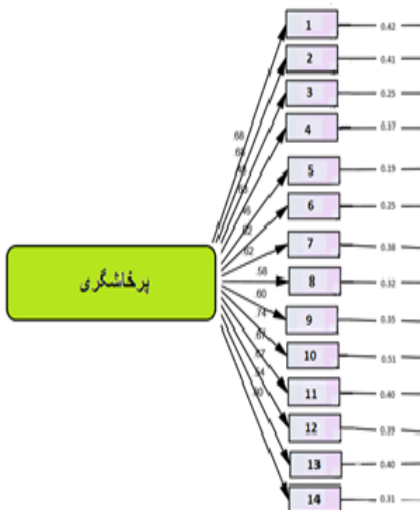
شکل ۲. مدل اندازه گیری پرخاشگری با بارهای عاملی استاندارد

مقایسه عوامل مرتبط با پرخاشگری در مردان تکواندوکار ... ۵۵