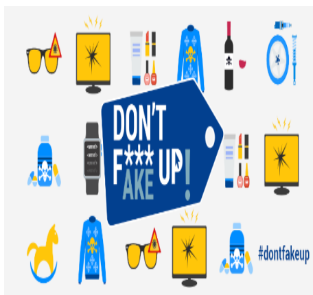
شکل ۲ - نمونه‌هایی از اینفوگرافی‌های آموزشی یورپول برای شهروندان ۱

نگاهی بر توافقنامه‌های یورپول با سازمان‌های بین‌المللی و کشورها ۲ : یورپول با امضای توافقنامه‌های همکاری با کشورهای خارج از حوزه کاری و سازمان‌های بین‌المللی به دنبال یکپارچه‌سازی و اثرگذاری بیشتر مبارزه علیه جرائم بوده است. به همین منظور، توافقنامه‌ای یورپول و آلبانی در سال ۲۰۱۳ امضا شده که در ماده ۴ آن تحت عنوان حوزه‌های همکاری، تبادل اطلاعات شامل اطلاعات روند تحقیقات جنایی، روش‌های پیشگیری از بروز جرائم، مشارکت در فعالیت‌های آموزشی و همچنین مشاوره و حمایت از تحقیقات جنایی فردی است. ۳ این همکاری علاوه بر مبادله اطلاعات مربوط به تحقیقات، شامل کلیه وظایف دیگر یورپول، به‌ویژه تبادل دانش تخصصی، گزارش وضعیت عمومی، نتایج حاصل از تحلیل استراتژیک، اطلاعات مربوط به مراحل تحقیقات جنایی، اطلاعات در مورد روش‌های