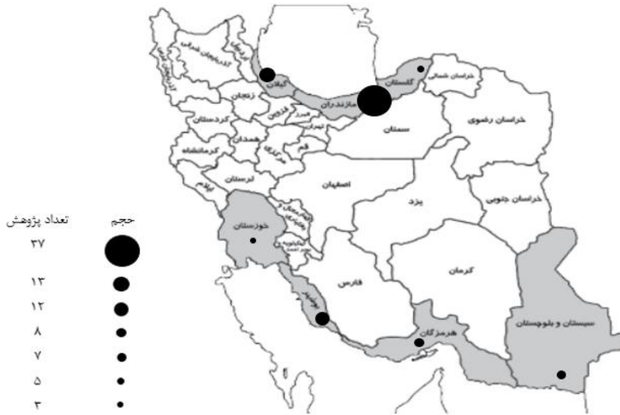
شکل ۱- پراکندگی مقالات علمی پژوهشی انجام شده گردشگری ساحلی و دریایی در ایران (۱۳۸۲-۱۳۹۹) (منبع: نویسنده، ۱۳۹۹)