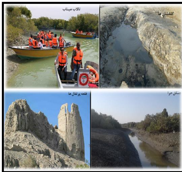
شکل ۲- عکس‌هایی از ژئومورفوسایت‌های انتخابی شهرستان میناب

برای ارزیابی برخی معیارهای علمی و مکمل همانند در دسترس بودن، بکر بودن، قابلیت مشاهده و ...، مشاهدات ارزیاب (در اینجا نگارندگان)، از طریق نرم افزار GIS، نقشه و مشاهدات میدانی متقن است و نیازی به کارشناس و نظر خواهی دیگران ندارد. اما برای برخی از معیارهای ژئومورفوسایت‌ها همچون محافظت، مدیریت و زیبایی‌شناسی باید از نظر کارشناسان متخصص و مدیر که به منطقه آشنایی کامل دارند استفاده شود. برای این منظور جامعه آماری این پژوهش از کارشناسان، مدیران، صاحب‌نظران و خبرگان عرصه گردشگری انتخاب شده‌اند که با حضور در محل کار به صورت حضوری و یا غیر حضوری و تلفنی از ایشان مصاحبه صورت گرفته است. ۳ نفر از اساتید عرصه گردشگری دانشگاه هرمزگان، ۷ نفر از مدیران و کارشناسان اداره کل استان و اداره شهرستان میناب و ۵ نفر از خبرگان و علاقمندان به طبیعت انتخاب شده و در پاره ای از معیارها نظرخواهی شده است. نمره کل معیار با توجه به پاسخ نظر سنجی لحاظ شده است. عوارض ژئومورفولوژیک منطقه مورد مطالعه در (جدول ۸) لیست شده است.