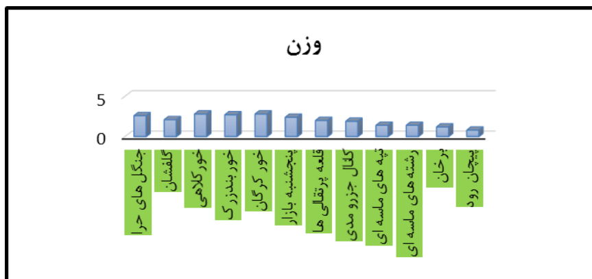
شکل ۳- نمودار معیار علمی ژئومورفوسایت‌های دشت میناب با استفاده از مدل رینارد