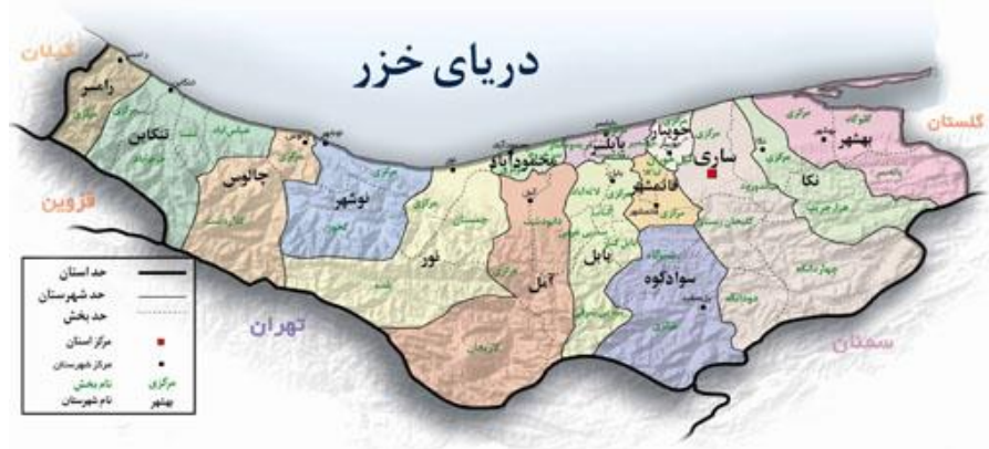
تصویر شماره ۱- نقشه استان مازندران

جمعیت تا ارتفاع ۲۰۰ متر از سطح دریا زندگی می‌کنند. مساحت پوشش دهنده استان تا ارتفاع ۲۰۰ متر ۲۳/۲۹ درصد است، این ارقام نشان می‌دهد که اکثریت جمعیت استان در کمتر از ۱/۴ مساحت استان که همان مناطق ساحلی می‌باشند، ساکن هستند. بنابراین، منطقه مذکور دارای تراکم جمعیت بالایی می‌باشد (مهندسين مشاور سبز اندیش پایش، ۱۳۸۵). به‌طور کلی، جلگه مازندران دارای آب و هوای معتدل و مرطوب است که معروف به آب و هوای معتدل خزری است. در سواحل و مناطق جلگه‌ای متوسط دما به بیش از ۱۶ سانتیگراد افزایش می‌یابد. تفاوت کم میانگین سالیانه حداقل و حداکثر دما در ایستگاه‌های ساحلی و جلگه‌ای نشان از اعتدال هوا در طول سال دارد. در این استان میزان بارندگی از غرب به شرق کاهش می‌یابد و از حدود ۱۲۰۰ میلیمتر در منطقه رامسر تا کمتر از ۷۰۰ میلیمتر در شرق کاهش می‌یابد، بیشترین بارندگی در فصل پاییز و تا بیش از ۴۷ درصد بارندگی سالیانه در ایستگاه‌های ساحلی اتفاق می‌افتد. دریای مازندران در شمال استان تهران، سمنان، در جنوب و استان‌های گیلان و گلستان به ترتیب در غرب و شرق آن قرار گرفته است. مازندران به خاطر جغرافیای سراسر متنوع آن که شامل جلگه‌ها، علفزارها، بیشه‌ها و جنگل‌های هیرکانی با صدها گونه گیاهی منحصر به فرد در جهان است و آب و هوای گوناگون از سواحل شنی با پست‌ترین نقطه، تا کوهستان‌های ناهموار و برف پوشیده البرز با داشتن کوه دماوند، شناخته شده است. موقعیت جغرافیایی استان مازندران به گونه‌ای است که از ۲۲ شهرستان این استان، ۱۵ شهرستان در خط ساحلی واقع هستند که ۳۳۸ کیلومترمربع ساحل دریای خزر را در بر گرفته‌اند.