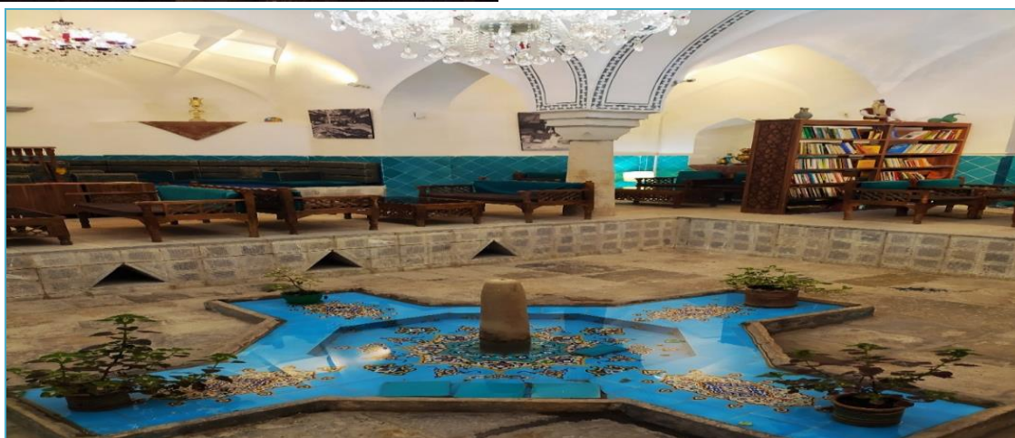
شکل ۲. نمادهای گردشگری شهر خرم آباد. منبع: نگارندگان، ۱۳۹۹