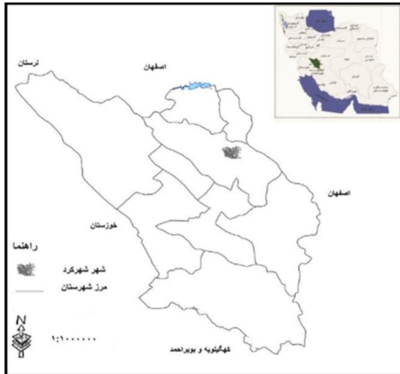
شکل ۱. موقعیت محدوده مورد مطالعه، منبع: نگارندگان، ۱۴۰۰