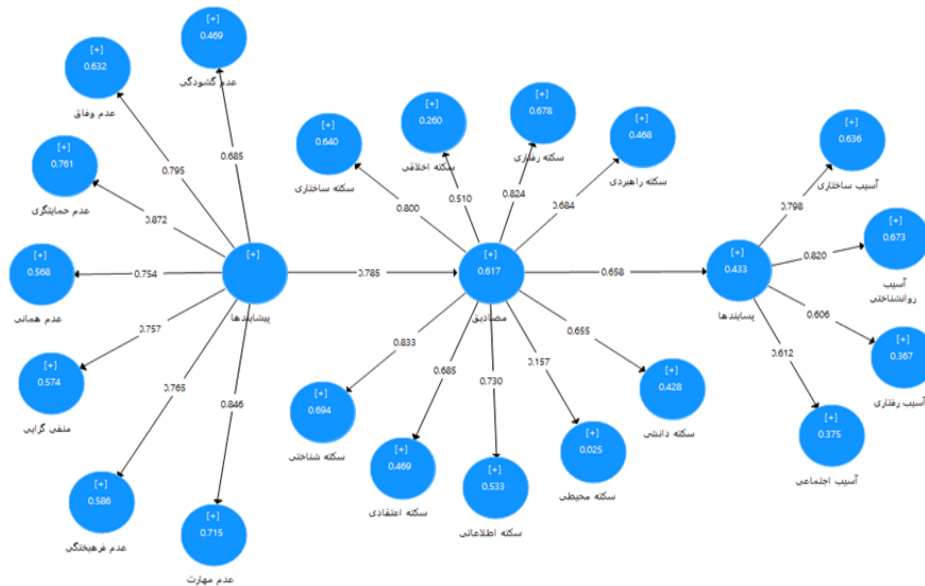
شکل ۲: مدل نهایی برای بررسی و آزمون فرضیه‌ها در حالت استاندارد