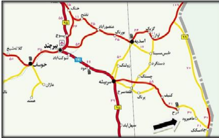
شکل شماره ۱. موقعیت منطقه ماهیروود سریشه در استان خراسان جنوبی