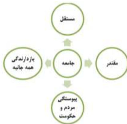
شکل شماره ۱: ویژگی‌های یک جامعه با امنیت کامل، منبع: (رضایی، ۱۳۸۴: ۲۱۸)

نقاط مثبت و فرصت‌ها بدل شد. تحولات سیاسی - نظامی در آغاز قرن ۲۱ سرعت چشمگیری یافت و در گستره جهانی، ناامنی‌هایی را به وجود آورد، به طوری که از نظر کارشناسان مهم‌ترین تهدیدات قرن ۲۱ برای کشورهای مختلف تهدیدات اقتصادی، ارضی، سیاسی و زیست‌محیطی است، پس منت رل مرزها امری ضروری است (پور موسوی، ۱۳۸۲: ۵۰-۴۳). در همین راستا یکی از بندهای موجود در چشم‌انداز ایران امنیت ملی است. امنیت ملی در بعد بیرونی، دارای دو شاخص استقلال (سیاسی، اقتصادی) و اقتدار می‌باشد. (رضایی، ۱۳۸۴: ۲۱۸).