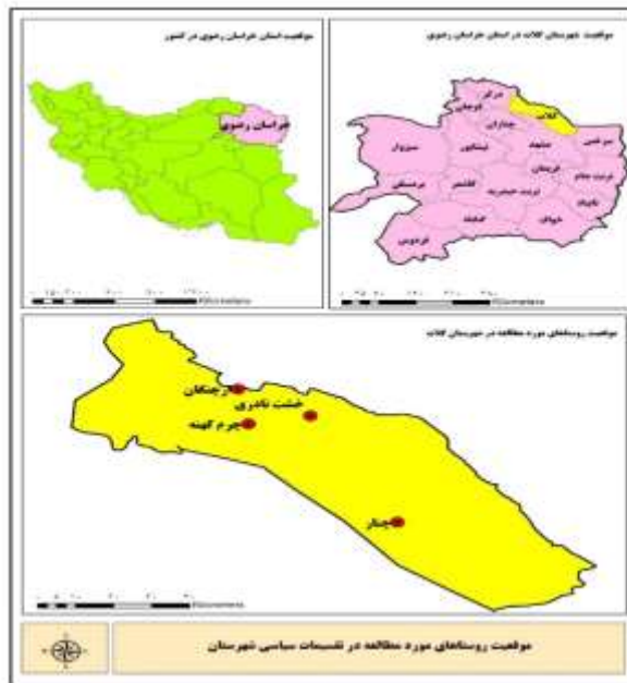
شکل شماره ۲. موقعیت جغرافیایی محدوده مورد مطالعه

این پژوهش از نظر هدف، کاربردی و از نظر روش توصیفی تحلیلی از نوع پیمایشی است. برای جمع‌آوری اطلاعات از ابزار پرسشنامه استفاده شده است. جامعه آماری پژوهش کلیه سکونت‌گاه‌های مرزی شهرستان کلات نادری، اعم از کوچ‌نشینان، روستاییان و شهرهای کوچک مرزی به تعداد ۱۳۰۴ نفر بوده‌اند. واحد نمونه‌گیری، اعضای روستاهای مناطق مرزی شهرستان کلات نادری می‌باشند. نقشه مربوط به جامعه آماری پژوهش در زیر آمده است.