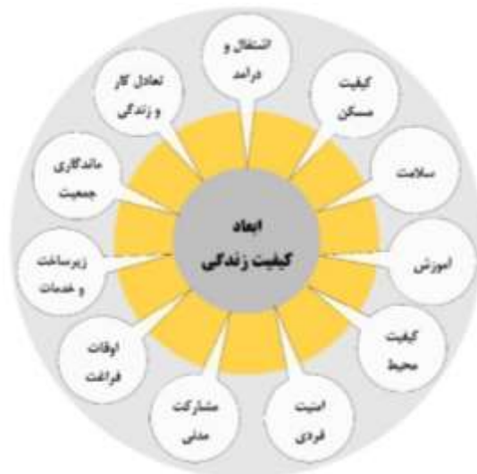
شکل شماره ۱. ابعاد کیفیت زندگی، منبع: (OECD, 2014: 15)

رویکردهای مربوط به کیفیت زندگی تاکنون در چهار دسته روان‌شناختی، جامعه‌شناختی، اقتصادی و بوم‌شناسی تبیین شده است. در چارچوب رویکردهای مذکور، نظریاتی مرتبط با مسئله کیفیت زندگی عرضه شده که در ادامه به بیان تعدادی از موارد مرتبط با تحقیق پرداخته شده است: