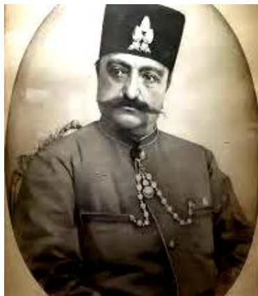
تصویر ۲: ناصرالدین شاه اثر مزین الدوله، ۱۳۱۲ق، مداد روی کاغذ، رقم جان تار علی اکبر، نگارخانه کاخ گلستان (کشمیرشکن، ۱۳۹۳: ۳۹)