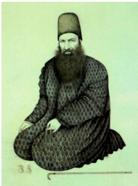
تصویر ۶: حاج میرزا سلیمان خان روح‌الملک، ابوتراب غفاری ۱۸۸۰-۱۸۸۹م آبرنگ روی کاغذ، موزه لوور پاریس (Diba, 1999: 254)

۴). او در حوالی سال ۱۲۹۳/۷۷-۱۸۷۶ به تهران رفت و وارد دارالفنون شد و در آنجا به فراگیری نقاشی و زبان فرانسه پرداخت. او نقاشی چیره‌دست بود و چندین نشان دریافت کرد. ابوتراب غفاری در فن چاپ سنگی مهارت داشت و تک‌چهره‌هایی عکس‌گونه برای روزنامه شرف و شرافت تهیه می‌کرد. بعد از وی، میرزا موسی و مهدی مصورالملک تصویرسازی‌های روزنامه شرف و شرافت را ادامه دادند و به رواج چاپ سنگی و مصورسازی کتاب‌های چاپی پرداختند (ریاضی، ۱۳۹۵: ۸۴). او در رجب ۱۳۰۷ ق در ۲۷ سالگی درگذشت (کریم‌زاده تبریزی، ۱۳۶۳: ج ۱، ۱۹). او یکی از مهم‌ترین هنرمندان دانش‌آموخته دارالفنون است که متأسفانه آثار زیادی از او برجای نمانده است و مکان برخی از آثار مشخص نیست. او دارای دست طراحی قوی می‌باشد و در شیوه پرداز ایرانی استاد بوده است. ذوق هنری در چهره‌نگاری با پرداز و طراحی‌های درخشان سیاه و سفید برای چاپ سنگی در آثار او دیده می‌شود که متأثر از روش طراحی مزین‌الدوله است.