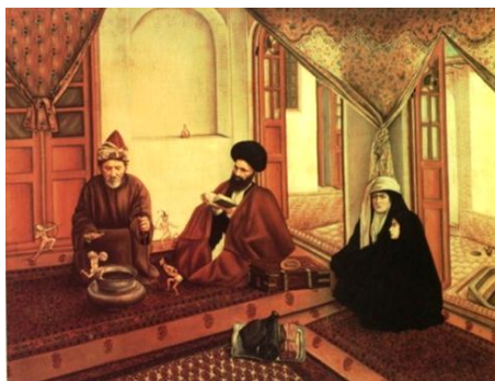
تصویر ۹: تابلوی جن‌گیر، کمال‌الملک، تهران، رنگ روغن، ۱۹۰۰م، موزه ملک، تهران (Diba, 1999: 274)