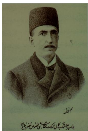
تصویر ۴: پرتره کمال‌الملک، مهدی مصورالملک، روزنامه شرافت، تهران، ش ۶۰، ۱۹۰۱م

(چاپ از سال ۱۳۱۴ق) این طرح‌های خطی انتشار می‌یافته است. این هنرمند قوانین مناظر و مریا را خوب می‌دانست و در آثار خود از آن بهره می‌یافت (کریم‌زاده تبریزی، ۱۳۷۰، ج ۳: ۱۲۴۷-۱۲۵۰). مهدی‌خان مصورالملک در واقع‌گرایی و رعایت قوانین پرسپکتیو و رنگ‌پردازی از هنرمندان بزرگ مشهور بوده و از دانش‌آموختگان دارالفنون و از شاگردان مزین‌الدوله است. او متأثر از مزین‌الدوله بوده و شیوه نقاشی او در واقع‌گرایی و چهره‌نگاری و به‌خصوص در طراحی، پیرو استاد خود بوده است.