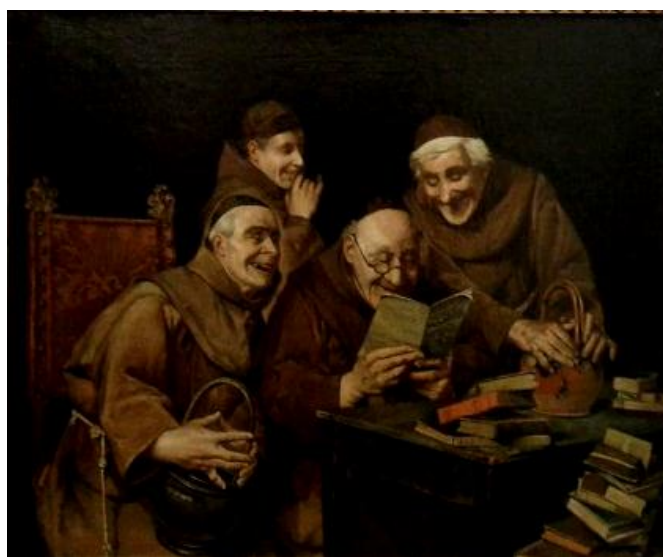
تصویر ۳: نمونه‌ای از نقاشی مزین الدوله، کشیشان، کاخ موزه سعدآباد، سال ۱۳۱۱ (رسولی پور، ۱۳۹۷: ۹۳)

از مزین الدوله به دلیل مشغله‌های حساس و سال‌ها ریاست دارالفنون آثار هنری اندکی برجای مانده است. در آثار او نخستین مورد دقت بالا و جزئیات در نقاشی‌ها، ساخت و پرداخت دقیق، رنگ‌پردازی و پرسپکتیو متناسب است. سعی در نشان دادن فلزات، سنگ و یراق آلات لباس به‌خوبی و دقت از ویژگی‌های کار اوست. با مطالعه آثار مزین الدوله مشخص می‌شود که او شیوه دارالفنون در دوره قاجار