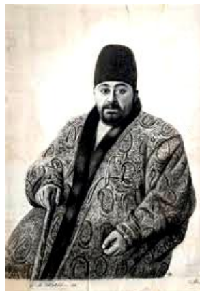
تصویر ۱: تصویر نقاشی میرزا عبدالوهاب خواجه نوری، نظام الملک، اثر مزین الدوله، ۱۳۱۱ق (رسولی پور، ۱۳۹۷: ۹۴)