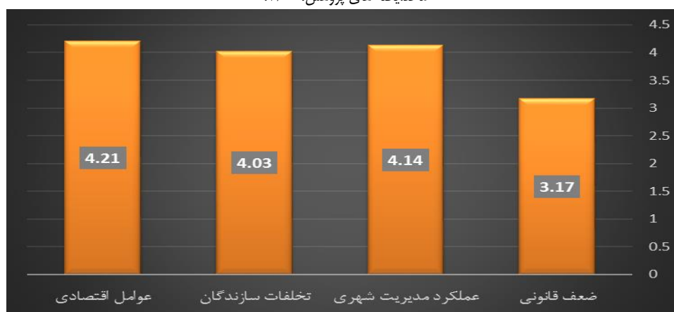
نمودار ۴- ارزیابی مهم ترین عوامل مؤثر بر افزایش تخلفات ساختمانی

بر اساس آمار و اطلاعات نمودار ۴، نتایج نشان می دهد که در مجموع زمینه های مهم ترین عوامل مؤثر بر افزایش تخلفات ساختمانی تعداد ۲۸ شاخص مورد مطالعه قرار گرفت. از این تعداد ۷ شاخص به عنوان متغیر ضعف قانونی، ۷ شاخص به عنوان متغیر ضعف اقتصادی تعیین گردید. در این زمینه عوامل اقتصادی با ۴.۲۱ معادل ۸۴٪ میزان تأثیر و عملکرد مدیریت شهری در زمینه تخلفات ساختمانی در ناحیه ۳ منطقه ۱۶ تهران ایفا می نمایند.