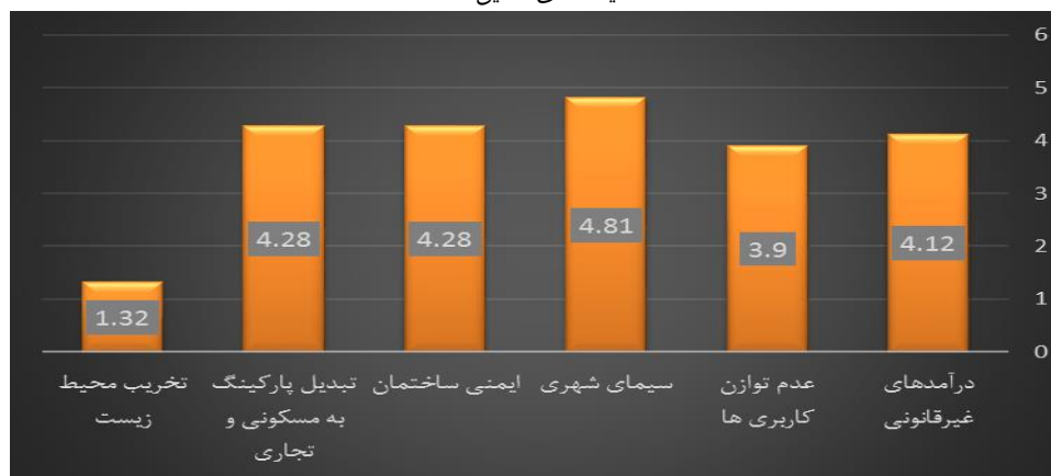
نمودار ۵- ارزیابی مهم ترین تبعات تخلفات ساختمانی در ناحیه ۳ منطقه ۱۶.

بر اساس داده های نمودار ۵، نتایج نشان می دهد که در زمینه ارزیابی مهم ترین تبعات تخلفات ساختمانی در ناحیه ۳ منطقه ۱۶ تهران در مجموع ۱۴ شاخص مورد مطالعه قرار گرفت. از این میزان، این چنین به نظر می رسد که مهم ترین تبعات ساختمانی در ناحیه ۳ بیشتر بر سیمای شهری با ۴.۸۱ و معادل ۹۶.۲ و سپس بر روی ایمنی ساختمان ها و تبدیل پارکینگ به مسکونی و تجاری با ۴.۲۸ معادل ۸۵.۶ تاثیر گذار است. در راستای روش تحلیل مسیر به به کارگیری تکنیک رگرسیون عوامل دخیل مهم ترین تبعات تخلفات ساختمانی وارد مدل تحلیل مسیر شدند. این عوامل عبارتند از درآمدهای غیرقانونی، عدم توازن کاربری ها، سیمای شهری، ایمنی ساختمان، تبدیل پارکینگ به مسکونی و تجاری و تخریب محیط زیست در این راستا در نهایت میزان اثر مستقیم هر یک از عوامل ضریب بتاهای هر یک از متغیرها مشخص شده و با استفاده از نمودار ترسیمی چگونگی اثرگذاری مستقیم تبعات تخلفات ساختمانی نمایش داده می شود.