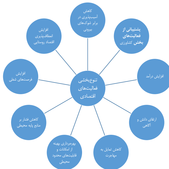
شکل ۱. مهم‌ترین کارکردهای تنوع‌بخشی فعالیت‌های اقتصادی

به‌طور کلی اقتصاد روستایی به تولید در بخش کشاورزی و صنایع وابسته به آن و بخش غیر کشاورزی، شامل معادن، صنایع دستی، ساخت‌وساز، تجارت، حمل‌ونقل، خدمات دولتی و شخصی گفته می‌شود. اقتصاد پایدار به تداوم و پایداری تولید و درآمد، مقاومت در برابر چالش‌های اقتصادی، اجتماعی و طبیعی اشاره دارد (تقدیسی و همکاران، ۱۳۹۷، ۳). در حال حاضر وابستگی اقتصاد روستایی به بخش کشاورزی و عدم پویایی و تنوع در آن منجر به افزایش آسیب‌پذیری در برابر شوک‌های بیرونی (خشک‌سالی‌های پی‌درپی، سرمازدگی، نوسان قیمت جهانی محصولات کشاورزی و ...) گردیده است. خشک‌سالی پرهزینه‌ترین بلای طبیعی بخش کشاورزی است و زیان‌های بسیاری را بر بخش کشاورزی و منابع آبی وارد می‌سازد و به دلیل اینکه محدوده‌ی وسیع‌تر و جمعیت بیشتری را دربر می‌گیرد، پیچیده‌تر از دیگر مخاطرات طبیعی است. با توجه به اینکه افزایش تقاضا برای آب، محدودیت ذخایر و منابع و تغییرات آب‌وهوایی، انتظار می‌رود تعداد و شدت خشک‌سالی‌ها در آینده افزایش یابد. از آنجاکه اقتصاد روستایی اتکالی قابل توجهی به فعالیت‌های کشاورزی دارد، شعاع تأثیر پدیده‌ی خشک‌سالی در مناطق روستایی بسیار بالاست (جعفری و همکاران، ۱۳۹۱، ۱۷۲). اهمیت رهیافت متنوع‌سازی فعالیت‌های اقتصادی بدان جهت است که حتی اگر کشاورزی دچار رکود (به دلیل خشک‌سالی و نوسان‌های بازار و ...) شود، اقتصاد روستایی غیر زراعی