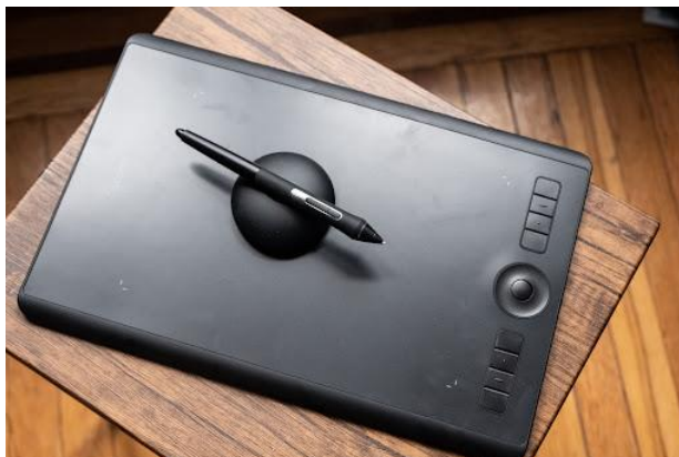
شکل ۱. قلم نوری ابزاری مفید برای تدریس در آموزش مجازی

کاهش می‌دهد. در این نوع آموزش، دانشجویان می‌توانند با خواندن پیام‌های قبلی در گروه درسی مشاهده کنند که آیا سؤالات آنها قبلاً توسط استاد پاسخ داده شده است یا خیر. چون تدریس ناهم‌زمان (مثل ایمیل) امکان مشاهده آسان سؤالاتی که قبلاً پاسخ داده شده‌اند را فراهم نمی‌کند، توصیه می‌شود یک سامانه ذخیره‌سازی ابری مشترک قابل جست‌وجو از سؤالات و جواب‌های قبلاً پاسخ داده شده ایجاد شود (مارتینوویچ، ۲۰۰۹). چهار نقش برای مدرسان آنلاین وجود دارد: نقش‌های آموزشی (پرسیدن سؤال، بررسی دانسته‌های دانشجو)؛ نقش‌های اجتماعی (ایجاد یک فضای دوستانه و راحت)؛ نقش‌های مدیریتی (حفظ ارتباطات و ایجاد قوانین و هنجارهای تدریس) و نقش‌های فنی. مدرسان باید به کتاب‌های درسی آنلاین، نسخه‌های دیجیتالی جزوه‌های کلاس و تکالیف کتبی دسترسی داشته باشند. برای سهولت در برقراری ارتباط ریاضیات از طریق متن، مدرسان می‌توانند هنگام استفاده از نرم‌افزارهای ریاضی، صفحه خود را به اشتراک بگذارند و یا از قلم نوری (شکل ۱) استفاده کنند. یکی از روش‌های جایگزین برای قلم نوری در تدریس مجازی دروس آمار و ریاضی استفاده از امکانات نرم‌افزار MathType (شکل ۲) است که مدرس می‌تواند با به اشتراک گذاشتن صفحه نمایش خود و تایپ فرمول‌های ریاضی در این نرم‌افزار تدریس کند. نرم‌افزارهای مشابه مثل LaTeX یا Maple نیز می‌تواند همین کار را انجام دهد، ولی کار کردن با نرم‌افزار MathType ساده‌تر است.