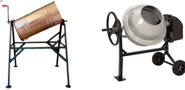
شکل ۱. مخلوطکن‌های دستی و برقی-دستی