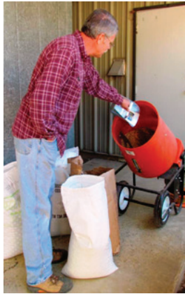
شکل ۲. نحوه اختلاط کود زیستی و بذر به وسیله مخلوطکن دستی