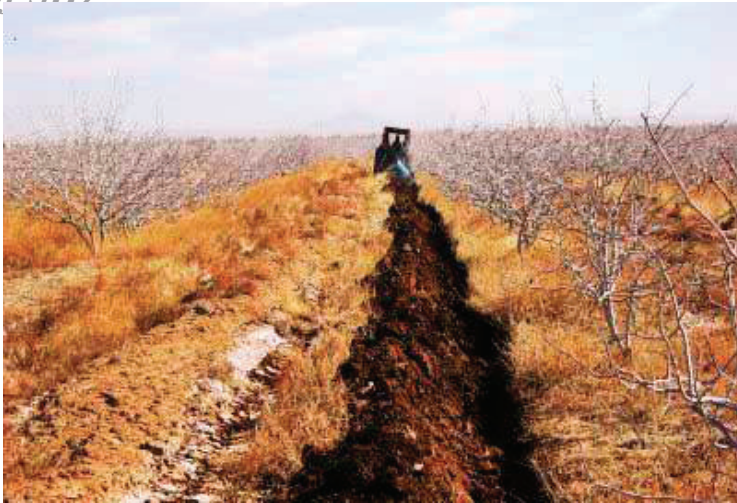
شکل ۵. مصرف کود زیستی در کانال کود