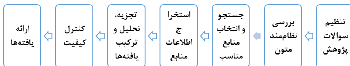
شکل ۱. الگوی هفت مرحله‌ای فراترکیب (اقتباس از سندلوسکی و باروسو، ۲۰۰۷)

در گام نخست با استفاده از روش فراترکیب مقوله‌های رقابت‌پذیری با تاکید بر آموزش سرمایه‌های انسانی در صنعت بانکداری کشور شناسایی شده است. فراترکیب یکی از روش‌های فرامطالعه است که به ارزیابی سایر پژوهش‌های انجام شده می‌پردازد و از این منظر با عنوان ارزشیابی ارزشیابی‌ها از آن یاد می‌شود. بطور کلی روش فراترکیب نوعی مطالعه کیفی است که از اطلاعات یافته‌های مستخرج از مطالعات دیگر در زمینه موضوع مرتبط، استفاده می‌کند. پژوهشگر در روش فراترکیب، داده‌های ثانویه نتایج حاصل از سایر مطالعه‌ها را برای پاسخگویی به نتایج مطالعه خود باهم ترکیب نموده و نتایج جدیدی بدست می‌آورد (Tulai, 2018, Jalali, Khaledi, 2019). برای دستیابی به هدف پژوهش از روش فراترکیب، مطابق از الگوی Sandelowski, Barroso (2006) استفاده شد.