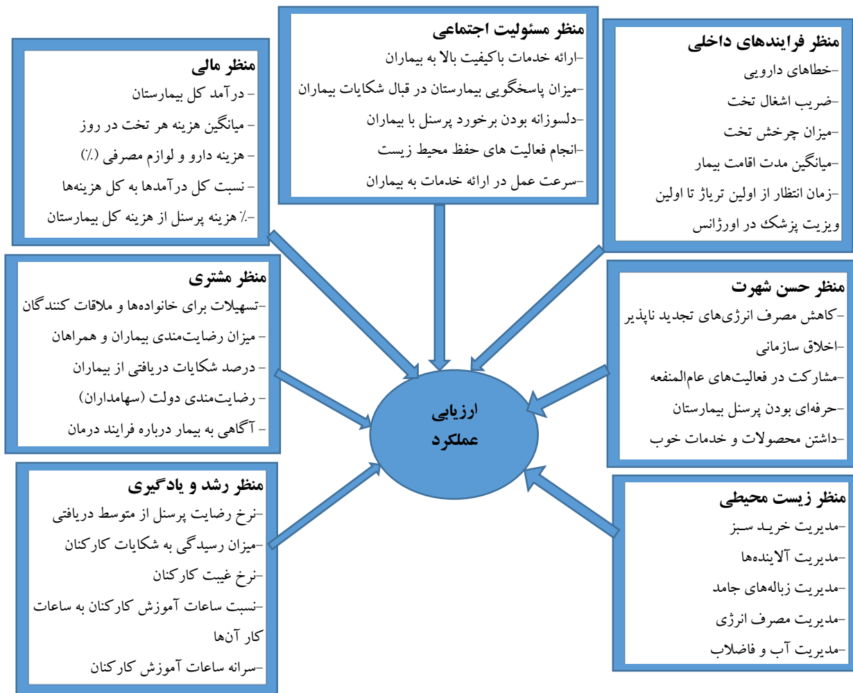
شکل ۲: الگوی ارزیابی عملکرد فازی برای بیمارستان های ایران با رویکرد کارت ارزیابی متوازن پایدار و حسن شهرت