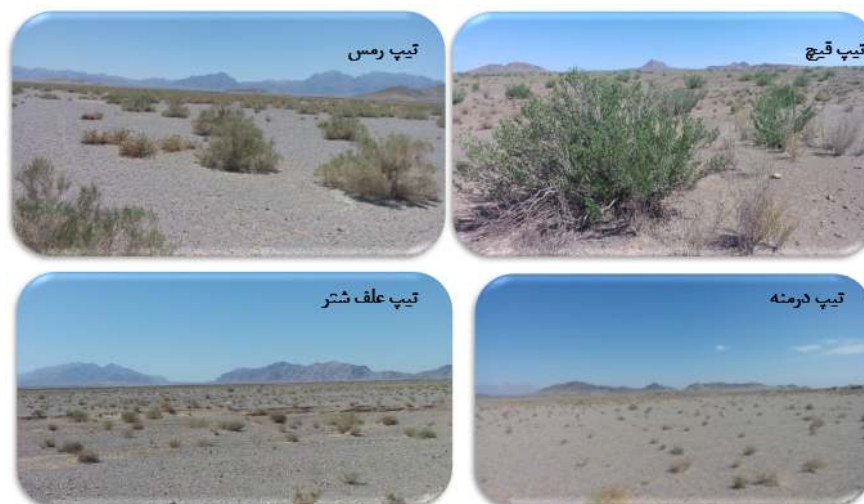
شکل ۲: تیپ‌های مورد مطالعه