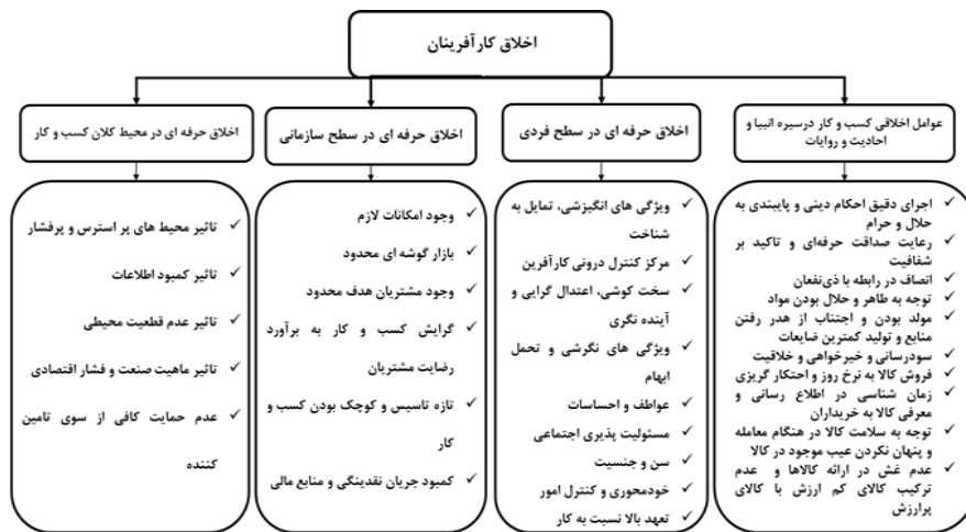
شکل ۳: الگوی اخلاقی کارآفرینان

احادیث با توجه به مصاحبه‌ها نیز به دودسته عوامل منطبق با قرآن کریم و عوامل منطبق با روایات تقسیم می‌شوند.