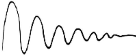
شکل ۱: همگراشدن مخاطب مذهبی با بازی

ممکن محتوای بازی را مطابق میل خود تغییر می‌داد، اما جایی که نمی‌توانست این کار را بکند نظر خود را تعدیل کرده و خود را با این که بازی بهشت است راضی می‌کرد. این موضوعات را در نمودار زیر می‌توان بهتر نشان داد: