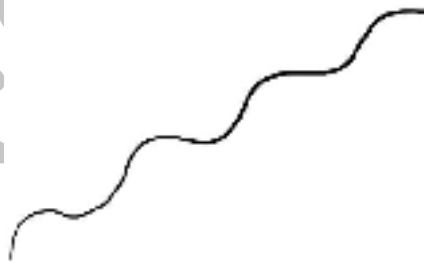
شکل ۲: هم‌افزایی مخاطب غیرمذهبی با محتوای بازی

شکل ۱ را می‌توان نشان‌دهنده برخورد یک فرد مذهبی با بازی دانست که در ابتدا در تقابل با آن قرار داشته و در نهایت در جایی در میانه اهداف اصلی بازی و تصورات مخاطب از آن با بازی به توافق می‌رسد. این موضوع یادآور نوع دوم کدگشایی مدنظر هال یعنی توافقی می‌باشد. اما هرچقدر فرد با پیش‌زمینه مذهبی کمتری با این بازی برخورد کرده‌است، این نمودار به سمت بالا متمایل گشته تا جایی که گاهی اوقات از هدف اصلی بازی نیز فراتر رفته و در هم‌افزایی با بازی در جایگاهی که حال آن را هم‌مونیک خوانده است قرار می‌گیرد. این موضوع در شکل ۲ مورد بررسی قرار گرفته است.