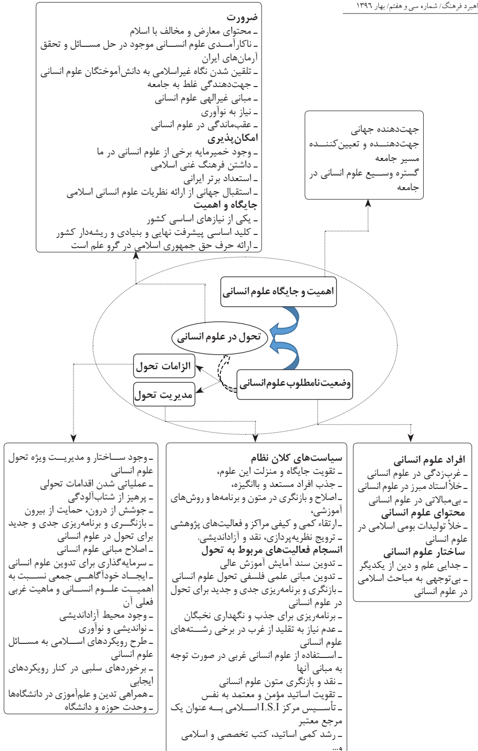
شکل ۱: مدل نهایی حاصل از مقوله ها و مفاهیم به دست آمده در پژوهش