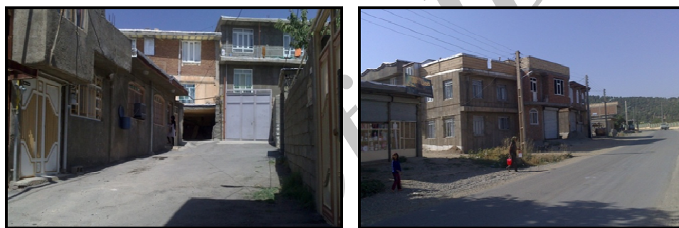
تصویر ۲: نمونه‌ای از الگوبرداری از معماری شهری در روستای خواجه‌میر

بنابراین ملاحظه شد که خانه‌های جدید اکثراً در بیرون از بافت قدیمی روستا ساخته شده‌اند (محل احداث)، و این نیاز به تغییر شبکه معابر و ایجاد فضای بلوک مانند جهت تخلیه وانت داران، و خودروهای شخصی برمی‌گردد که نیاز به تغییر شبکه معابر (تصویر شماره ۱) و در نتیجه خیزش به سمت زمین‌های اطراف فضای مسکونی جهت احداث معماری جدیدتر با معابر عریض‌تر وجود داشته و این امر در مشاهدات میدانی به صورت بارز دیده شده است. پدیده دیگر ورود مصالح غیربومی با دگرگونی در سنت ساخت و ساز و الگوبرداری از معماری شهری (تصویر شماره ۲) است که متأثر از افزایش درآمد روستائیان و نیز افزایش ارتباطات با شهر است.