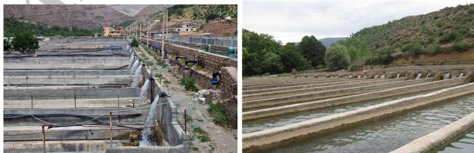
مجتمع پرورش ماهی روستای پالنگان