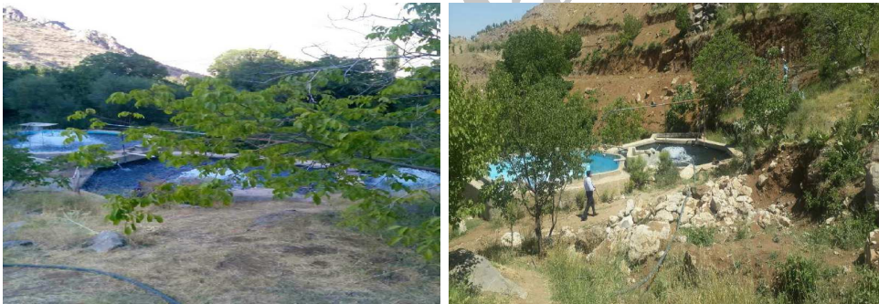
مجتمع پرورش ماهی روستای تخت زنگی

روستاها بوده است. این معضل در روستاهای مورد پژوهش نیز به‌نحوی بارز مشهود است. برخی سرمایه‌گذاری‌های شهری به این معضل دامن زده، در روند آلودگی منابع آب و خاک روستایی نقش بارزی داشته‌اند. سرمایه‌گذاری‌های شهری، به‌ویژه در زمینه پرورش آبزیان، با ایجاد تأسیسات در کنار و یا حتی در مسیر رودخانه‌ها، ضمن بهره‌گیری از آب سالم رودخانه‌های محلی، زمینه‌ساز آلودگی جدی منابع آب روستاها شده‌اند. ورود فاضلاب این گونه تأسیسات به آب رودخانه‌ها، در کنار فاضلاب‌های خانگی، نه تنها موجب آلودگی، بلکه به خطرانداختن بهداشت و محیط زیست روستاییان شده است، به‌خصوص آن‌که اغلب رودخانه‌های محلی از میان بافت روستاها جریان دارند. از روستاهای محدوده که بیشتر در معرض این روندهای آلوده‌ساز هستند، می‌توان از روستاهای پالنگان، لون سادات، دژن، ماویان، کوره دره علیا، کلاته و لون کهنه نام برد. این روستاها به‌سبب قرارگیری در حاشیه و یا دو سوی رودخانه گاورود، بیشتر در معرض آلودگی‌های حاصل از ورود فاضلاب‌ها و بعضاً زباله‌های خانگی و نیز فاضلاب تأسیسات پرورش ماهی و مانند آن هستند.