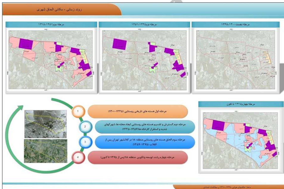
شکل ۲. روند زمانی و مکانی الحاق منطقه ۱۸

د. مرحله چهارم؛ رشد، توسعه و تکوین منطقه ۱۸ (از ۱۳۷۵ تاکنون): این دوره، دوره استحاله کامل هسته‌های روستایی با بازخورد فعالیت‌های نادرست و پیامدهای زیست‌محیطی است بر اثر گسترش و خزش شهری؛ فقط نامی از این روستاها باقی‌مانده است در این دوره خانه‌های قدیمی روستایی با بافتی جدید تحلیل رفته؛ بهره‌برداری از معادن شن و ماسه یکی از معضلات بسیار مهم منطقه گردیده است؛ تداخل بافت‌های صنعتی مشکلات بسیاری را بر محدوده متحمل نموده است. این تحولات به‌گونه‌ای سریع در محدوده شکل می‌یابد که نابسامانی زیست‌محیطی بسیاری را در سطح منطقه ایجاد می‌نماید.