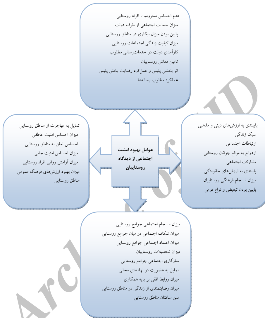
شکل ۱. چارچوب نظری پژوهشی؛ منبع: یافته‌های تحقیق (۱۳۹۴).

پیش‌نگاشته‌های موضوع و بر اساس اهداف پژوهش، در شکل (۱) ارائه شده است.