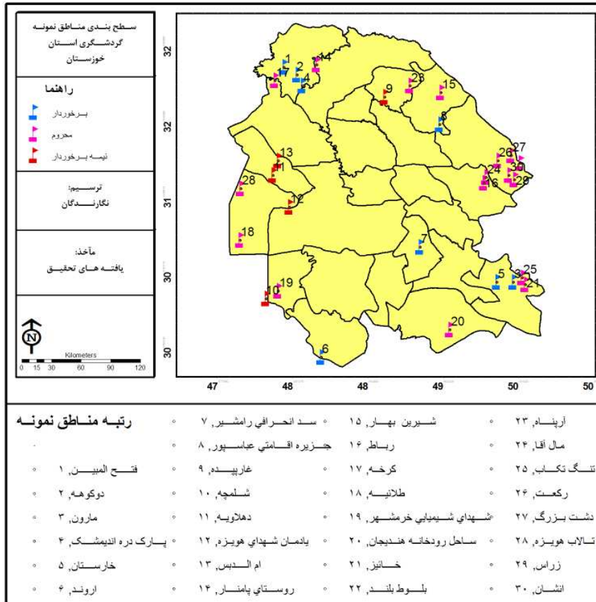
شکل ۳: سطح‌بندی مناطق نمونه گردشگری استان خوزستان

ضعیف هستند که این کمبود و ضعف برای مناطق مختلف متفاوت است. عمده مناطق قرار گرفته در این دسته جزء مناطق خوش آب‌وهوا و ییلاقی استان، بویژه در فصل تابستان هستند که متأسفانه به دلیل عدم وجود امکانات و زیرساخت‌ها نتوانسته‌اند در جذب گردشگران بویژه گردشگران داخلی موفق باشند.