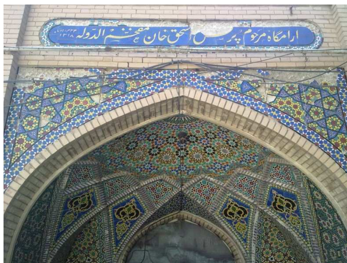
شکل ۲. نمونه‌ای از معدود آرامگاه‌های واجد ارزش معماری در گورستان امامزاده عبدا...