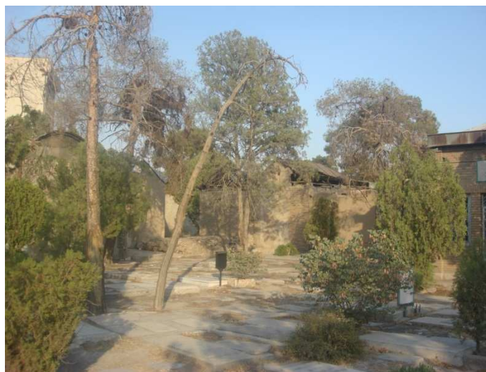
شکل ۳. گورستان‌های مورد مطالعه با وجود ظرفیت بالقوه فراوان برای ایجاد فضای سبز شهری، با ساختمان‌های مخروبه و پوشش سبز روبه‌زوال، منظری مشمئزکننده برای شهر بوجود آورده‌اند

نازیا عرضه می‌دارند که هر کس از آن گریزان است و رغبتی به وقوف ندارد و مگر بر حسب اضطرار دقایقی بیش تحمل نمی‌کند. این‌ها منظر شهری را بی‌نهایت زشت جلوه می‌دهند. در این دو گورستان و به‌ویژه در امامزاده عبدا... مقبره‌های مخروبه با سقف‌های در حال فروریزی و دیوارهای درحال تخریب، منظر محله را بی‌نهایت زشت و غیرجذاب ساخته‌اند. در ابن‌بابویه گرچه غالب مقبره‌ها در اقدامات شهرداری در دهه ۱۳۷۰، تخریب شده‌اند اما معدود مقبره‌های موجود و دیوارهای محصورکننده قبرستان، از داخل منظری زنده ارائه می‌نمایند. هرآینه امکان ریزش سقف و دیوار مقبره‌ها، خطرات جانی پیش روی مراجعه‌کنندگان قرار می‌دهد. در گورستان امامزاده عبدا... جز تعدادی معدود، ساختمان مقبره‌ها و آرامگاه‌های خانوادگی همه فرسوده و دیوارهای خشت و گلی و سقف‌های چوبی موربانه‌زده آنها اغلب در حال تخریب به نظر می‌رسند. به‌نظر می‌رسد در برخی مقبره‌ها سال‌هاست کسی از بستگان وارد نشده و شاید به دلیل احتمال خطر جانی در اثر فروریزی جرات ورود نداشته است. شهرداری نیز از نوسازی و مرمت مقبره‌ها شدیداً ممانعت به عمل می‌آورد.