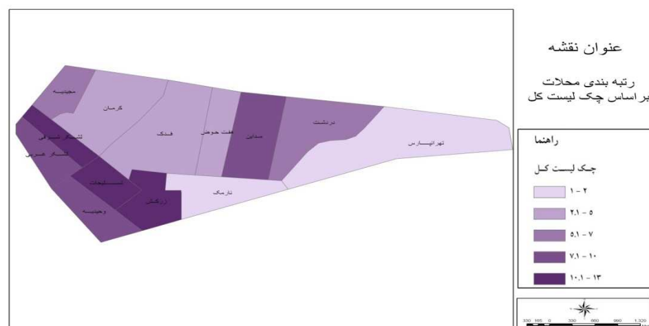
نقشه ۱: رتبه‌بندی محلات بر اساس چک لیست کل

این مقایسه‌ها درباره تک‌تک مولفه‌های چک لیست نیز انجام شد. به این صورت که تک‌تک محلات در مورد تک‌تک مولفه‌ها با یکدیگر مقایسه شدند و رتبه محله‌ها در مورد هر یک از شاخص‌های اصلی مشخص گردید. سپس برای خوشه‌بندی محلات از نظر مولفه‌های چک لیست جامع عوامل محیطی از تحلیل خوشه‌ای به روش پیوندهای کامل، متوسط تکی و وارد استفاده شد. با توجه به نتایج نمودارها خوشه‌بندی روش‌های پیوند کامل، متوسط و وارد یکسان است، ولی خوشه‌بندی با استفاده از پیوند تکی نسبتاً با سه روش دیگر متفاوت است. در اینجا تنها یکی از نمودارها نشان داده می‌شود.