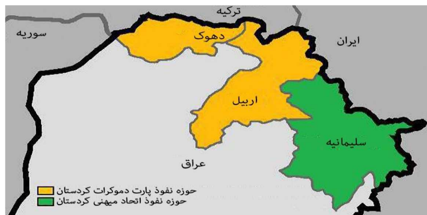
نقشه ۱: مناطق تحت نفوذ احزاب اصلی و تاریخی اقلیم مردستان عراق

منطقه اقلیم کردستان عراق از دیرباز محل تاسیس و فعالیت احزاب سیاسی فراوانی بوده است. مهمترین این احزاب که از سابقه طولانی برخوردار بوده و هم‌اینک نیز حاکمیت را در اختیار دارند حزب دمکرات کردستان عراق (پارتی) و اتحاد میهنی کردستان (په‌کیه‌تی) است. حزب دمکرات در حال حاضر، ریاست اقلیم کردستان (مسعود بارزانی) و حاکمیت اصلی را در اختیار خود دارد (باقری، ۱۳۹۲: ۱۵۵). حزب اتحادیه میهنی منطقه جنوب و جنوب‌شرقی اقلیم کردستان را تحت‌کنترل خود دارد.