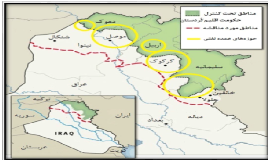
نقشه ۲: مناطق نفت‌خیز مورد اختلاف حکومت اقلیم کردستان و حکومت مرکزی عراق