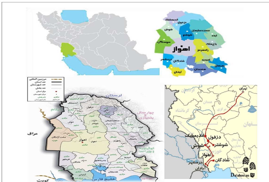
شکل ۱. موقعیت جغرافیایی شهرستان شوشتر در کشور ایران