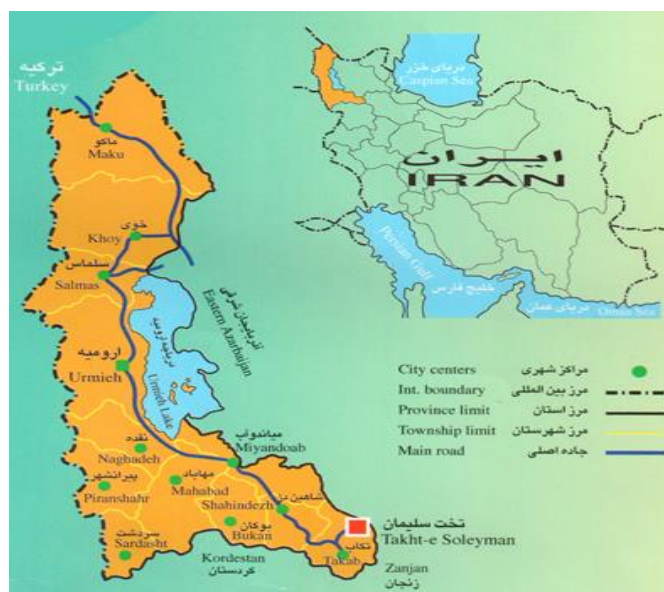
شکل ۱: نقشه ایران و موقعیت شهرستان تکاب و تخت سلیمان

با توجه به این‌که شهرستان تکاب از لحاظ قدمت تاریخی به دلیل وجود آثار باستانی متعددی از قبیل تخت سلیمان، دارای جاذبه‌های تاریخی فراوانی بوده و همچنین برخوردار از آب و هوای معتدل در ماه‌های گرم سال و وجود مناظر و جاذبه‌های طبیعی زیبا و بکر، توجه به پتانسیل‌های موجود در منطقه و یک برنامه‌ریزی صحیح و راهبردی می‌تواند این شهر را به یکی از مقصدهای مهم گردشگری در کشور تبدیل کند. اما عدم زیرساخت‌های مناسب و نگاه نامناسب برنامه‌ریزان و متولیان توسعه منطقه و همچنین استفاده نامطلوب از منابع منطقه، این شهرستان را تبدیل به یک منطقه محروم کرده است. ولیکن مساله این است که علی‌رغم وجود چنین پتانسیل‌هایی، چرا تاکنون نسبت به بهره‌گیری از قابلیت‌ها و امکانات منطقه، در زمینه توسعه گردشگری اقدامی صورت نگرفته و اساساً، چگونه می‌توان با استفاده از مزیت‌های آن تقویت زمینه توسعه گردشگری را در این شهرستان فراهم نمود؟