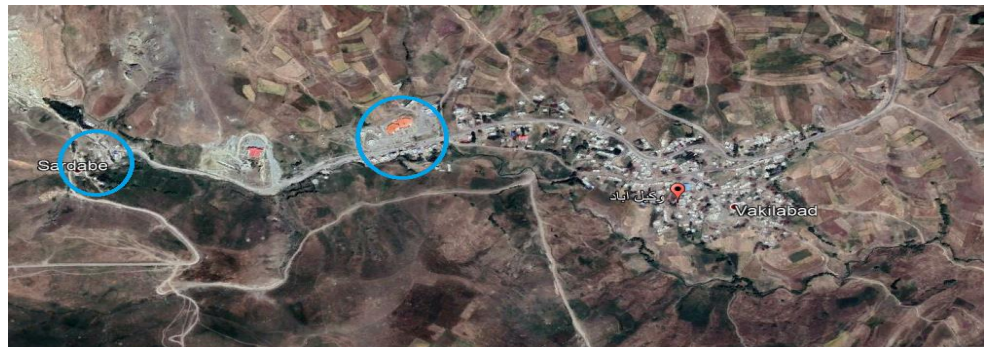
شکل ۵: مکان‌گزینی کاربریها در ارتباط با چشمه (روستای وکیل آباد)