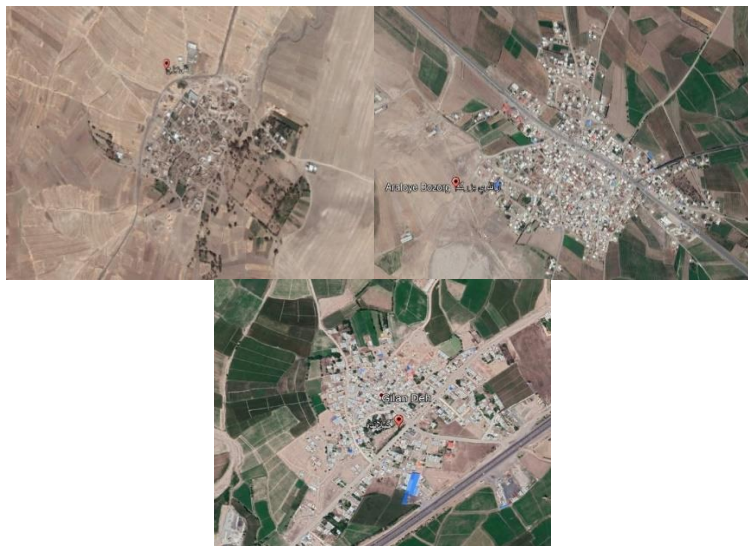
شکل ۴: بافت فشرده روستاها بر اثر اقلیم سرد

موقعیت، ارتفاع، دوری و نزدیکی به دریا و نیز عناصر اقلیمی، همچون رطوبت، بارش، گرما و زاویه تابش، مد نظر قرار می‌گیرند. در ناحیه مورد بررسی، بافتهای فشرده را اغلب به سبب استقرار در اقلیم سرد و کوهستانی بشمار آورده‌اند، حال آنکه ممکن است عواملی دیگر، مثلاً منبع تامین آب (قنات) یا عنصری ارزشمند بلحاظ مذهبی (امامزاده)، به کمک عوامل دیگر زمینه‌ساز آن بوده باشد (سعیدی، ۱۳۸۸، ۵۳-۵۴). هرچند این نیز واقعیت دارد که در اغلب روستاهای ناحیه، بویژه روستاهای دامنه‌ای و کوهستانی، فشردگی بافت به سبب اقلیم سرد و پیشگیری از اتلاف انرژی است.