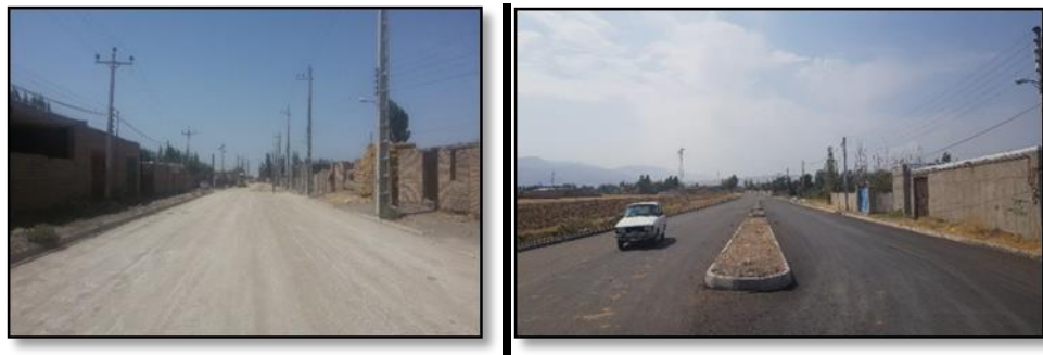
شکل ۳: تحولات فضایی ناشی از اجرای طرح هادی

همگام با تحولات اجتماعی- اقتصادی و گسترش فناوریهای گوناگون، از یکسو و فشردگی هرچه بیشتر تعامل روستایی- شهری و تغییر رفتار اجتماعی- اقتصادی روستاییان، کاربریهای روستایی نیز دستخوش دگرگونی می‌گردد. این روند دگرگونی، به نوبه خود، ساختار عمومی بافت روستا را دستخوش تحول می‌سازد (ضمنا نک: سرتیپی پور، ۱۳۸۸، ۵۵). تغییرات کاربری اراضی در روستاها عموماً شامل روند تغییر کاربری اراضی کشاورزی به نفع دیگر کاربریها (مسکونی و کارگاهی) است. این تغییرات قاعدتاً متأثر از نیروها و عوامل درونی و عوامل و نیروهای بیرونی، تحت تاثیر روابط روستایی- شهری، حادث می‌شوند (سعیدی و همکاران، ۱۳۹۵: ۲۸). گاهی بنظر می‌آید، این عوامل و نیروها به تنهایی در تعیین نوع کاربری و نهایتاً بافت دخالت دارند، اما بایست توجه داشت که اثرگذاری عوامل و نیروها در اغلب موارد بصورتی ترکیبی و هم‌افزا اتفاق می‌افتد. از این رو، بررسی تجربیدی آنها و منحصرکردن "فردی" این نیروها و عوامل در برپایی کاربریها و بافت، نادرست و غیرعلمی است. در اینجا، این عوامل، خلاصه‌وار و به شرح زیر، مورد بحث و نتیجه‌گیری قرار می‌گیرند.