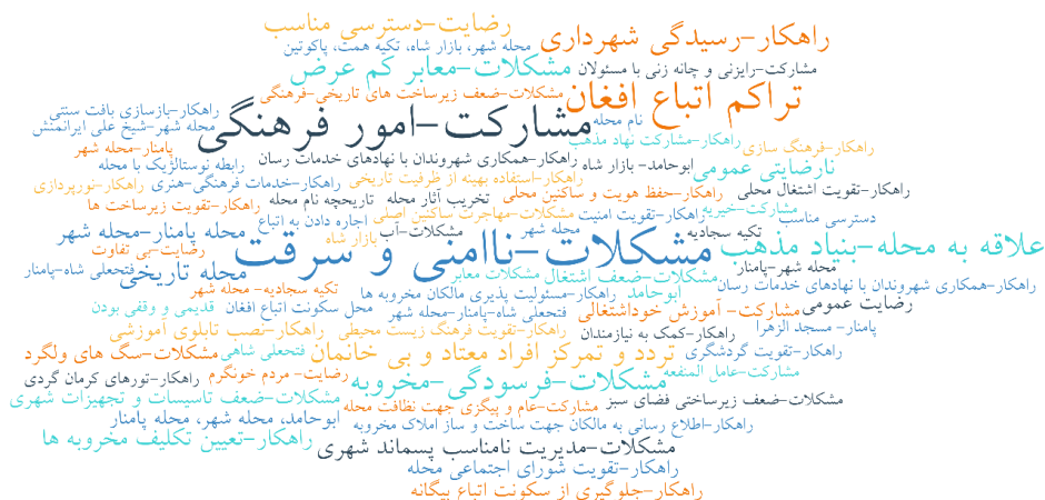
شکل ۳: ابر واژگان، مقوله‌های شناسایی شده در مصاحبه شهروندی

در ادامه ابر کدها (مقوله‌های) شناسایی شده ارائه شده است. بزرگی مقوله‌ها نشان‌دهنده تکرار بیشتر و در نتیجه اهمیت بیشتر آن‌ها از نظر شهروندان بوده است.