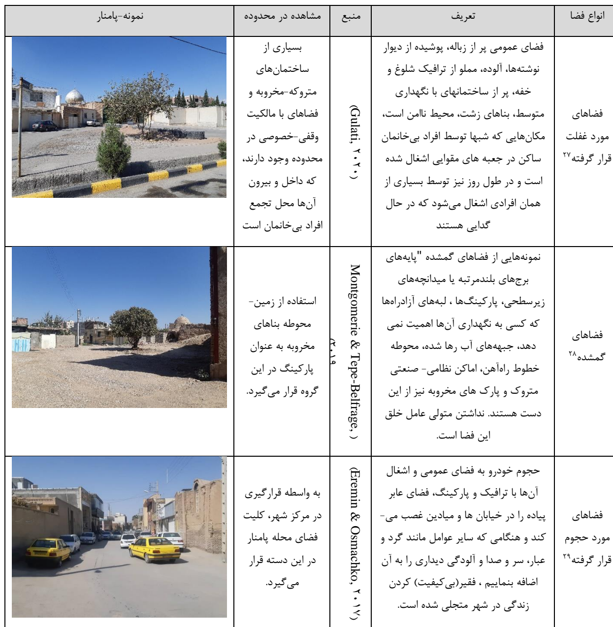
جدول ۲: انواع فضاهای شهری مسئله دار