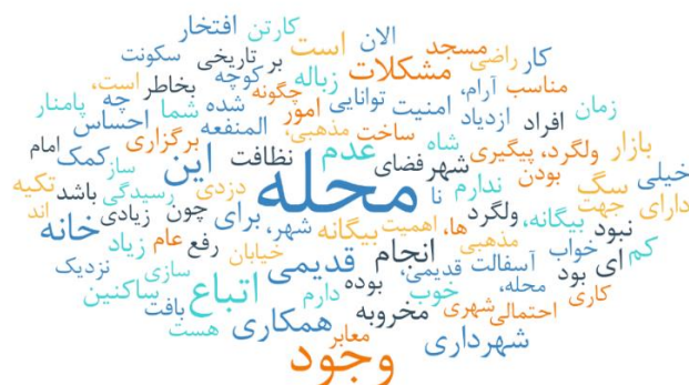
شکل ۲: ابر واژگان، مربوط به نظرات شهروندان مورد مصاحبه قرار گرفته

در ادامه، سطح دوم تحلیل بر مبنای حوزه‌ها، مقوله‌ها (اصلی و فرعی) و زیرمقوله‌ها (اصلی و فرعی) ارائه شده است. این تقسیم‌بندی توسط پژوهشگر و براساس شباهت مضامین ذکر شده توسط شهروندان به انجام رسیده است. همانگونه که ملاحظه می‌شود، پنج حوزه مضمونی اصلی توسط شهروندان ارائه شده است. این حوزه‌ها شامل ادراک از نام محله، ویژگی محله، مشکلات محله، راهکارهای حل مشکل و درنهایت نوع مشارکت قابل انتظار از شهروندان به انجام رسیده است. در ادامه تحلیل‌های مبتنی بر هر مقوله ارائه شده است.