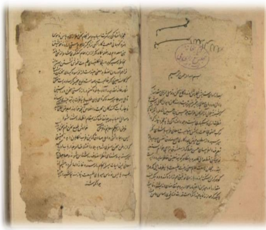
برگ اول نسخه مجلس (نسخه اساس)، دیباچه