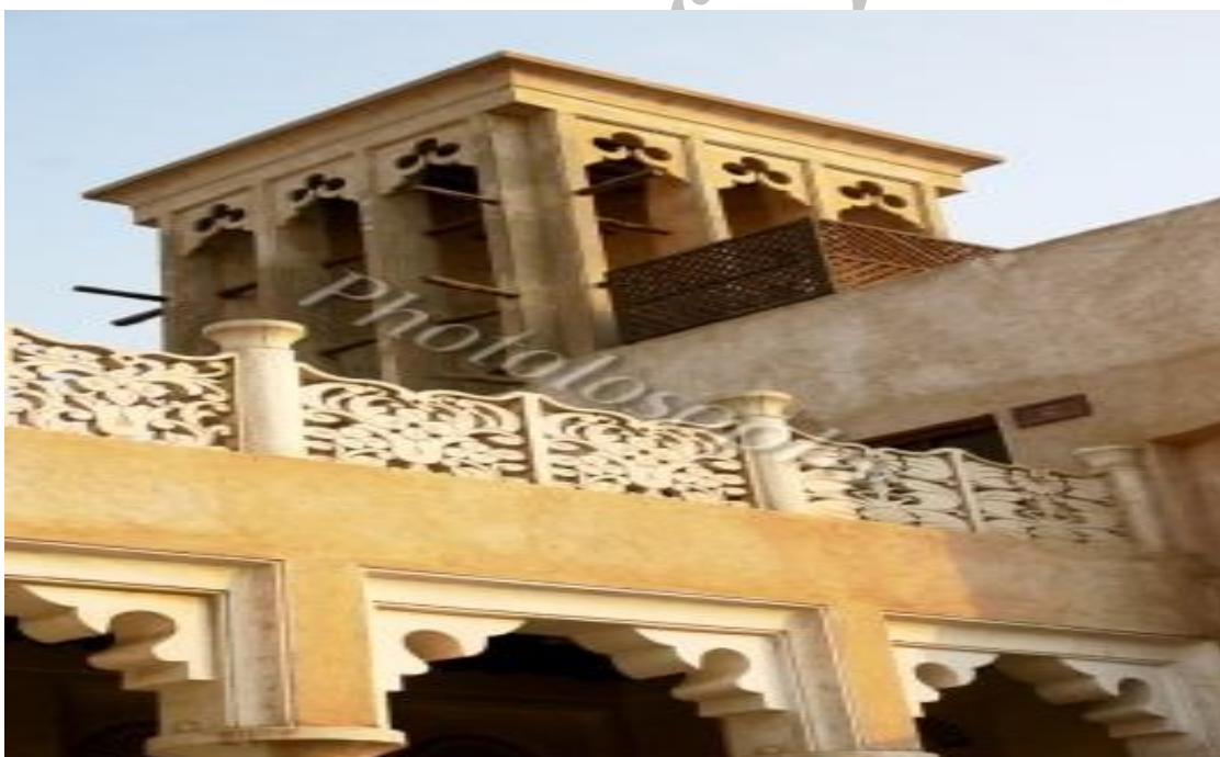
عکس شماره ۴: بادگیرخانه های بستکيه (۲)