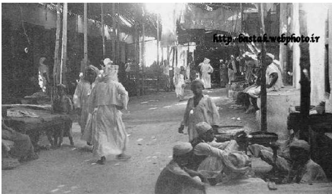
عکس شماره ۱: تصویری از بازار قدیمی دبی که اکثر تجار آن از مهاجران بستکی ساکن بستکيه بودند.