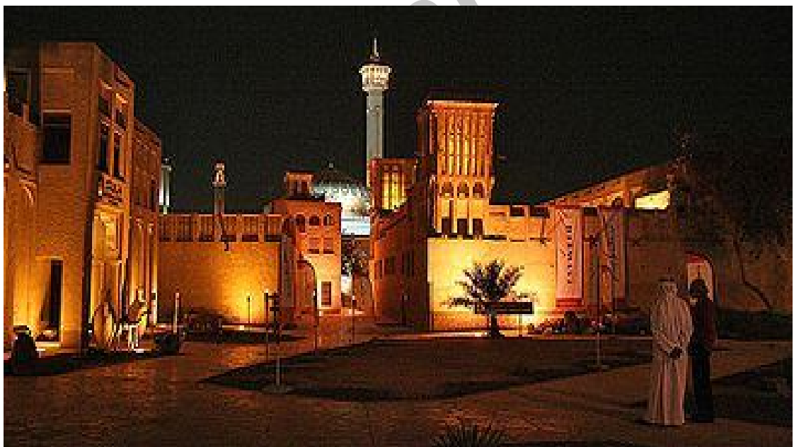
عکس شماره ۸: نمایی از مرکز البستکیه در شب