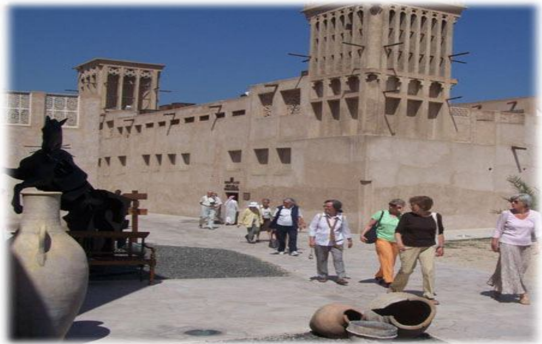
عکس شماره ۷: بازدید توریست‌ها از محله البستکیه