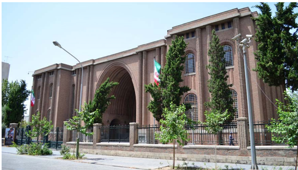
تصویر ۳. موزه ایران باستان امروز