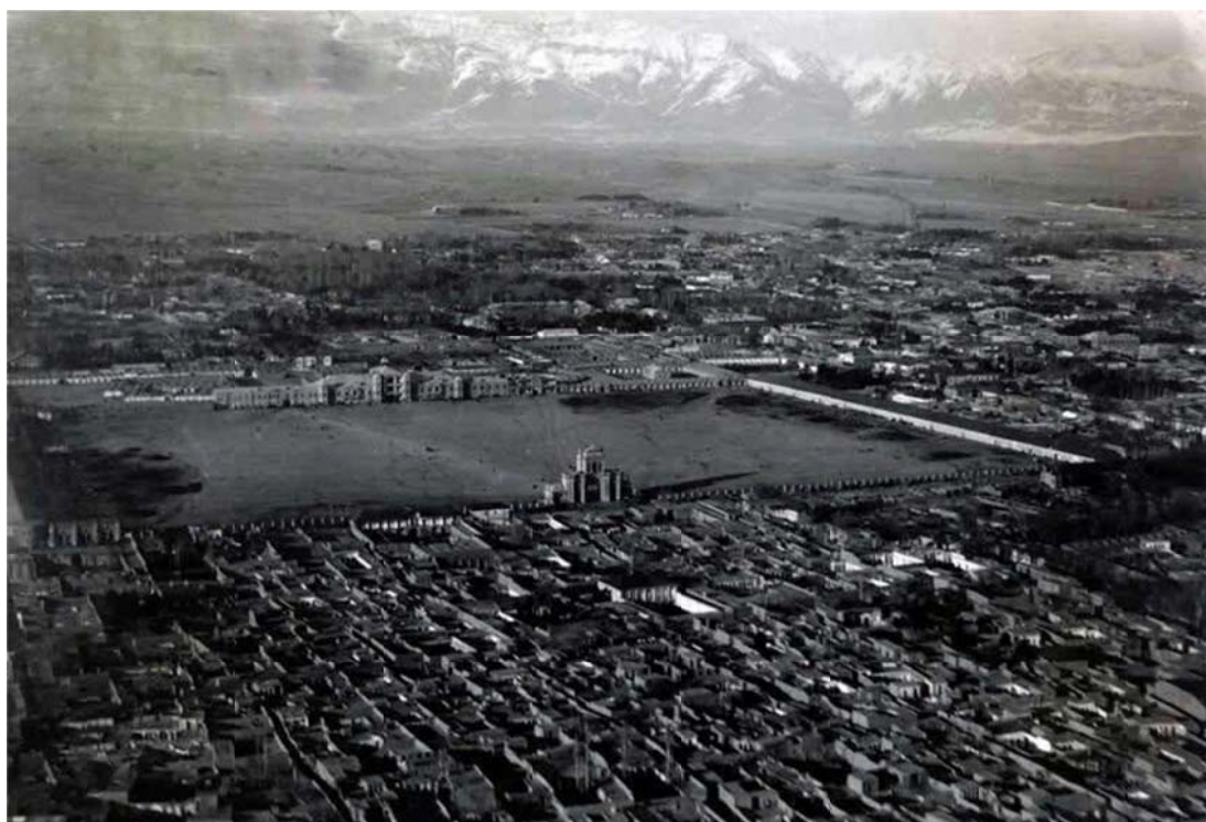
تصویر ۱. میدان مشق تهران پیش از بنای موزه ایران باستان