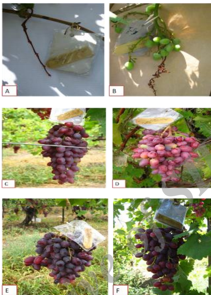
شکل ۲. تیمارهای گرده افشانی

A: خودگرده افشانی (داخل پاکت کاغذی)؛ B: گرده افشانی آزاد (داخل توری)؛ C: دگرگرده افشانی (ریش با یا × قزل اوزوم)؛ D: دگرگرده افشانی (بی دانه سفید × قزل اوزوم)؛ E: دگرگرده افشانی (تبرزه سفید × قزل اوزوم)؛ F: دگرگرده افشانی (عسگری × قزل اوزوم).