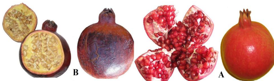
شکل ۱. میوه سالم (A) و آفتاب‌سوخته (B) انار ملس ترش ساوه

این آزمایش روی درختان شش ساله انار رقم ملس ترش ساوه در یک باغ تجاری واقع در شهرستان ساوه (۳۴/۹۹ درجه عرض شمالی و ۵۰/۲۵ درجه طول