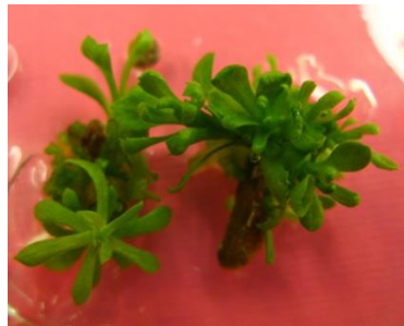
شکل ۱. باززایی مستقیم شاخساره از ریزنمونه دمبرگ در تیمار T3 که حاوی ۳ میلی‌گرم در لیتر BAP بود.

(جدول ۲). این مسئله تأیید کرد که سایتوکینین‌ها توأم با اکسین‌ها، نقش مهمی را باززایی شاخساره در داوودی بر عهده دارند (Karim et al., 2003).