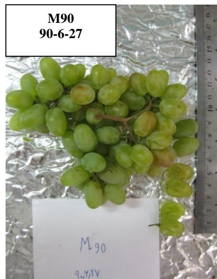
شکل 3. نژادگان به کلی بی دانه M90 انگور Figure 3. Seedless grape genotype M90