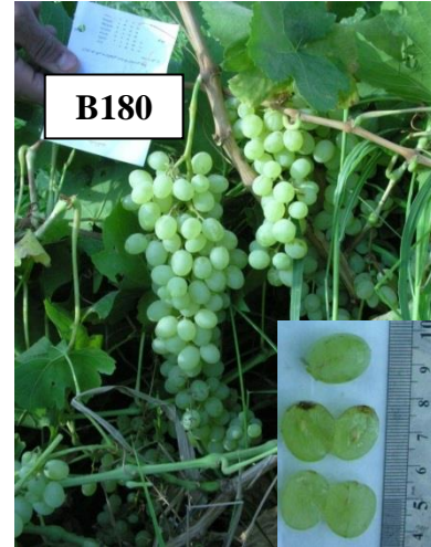
شکل 1. نژادگان بی دانه B180 Figure 1. Seedless grape genotype B180