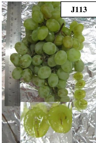
شکل 5. نژادگان به نسبت بی دانه J113 انگور Figure 5. Relatively seedless grape genotype J113