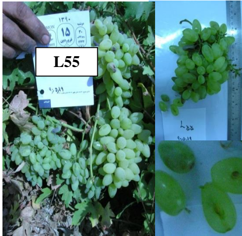
شکل 4. نژادگان بی دانه L55 انگور Figure 4. Seedless grape genotype L55