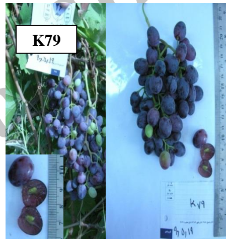
شکل 2. نژادگان بی دانه K79 Figure 2. Seedless grape genotype K79