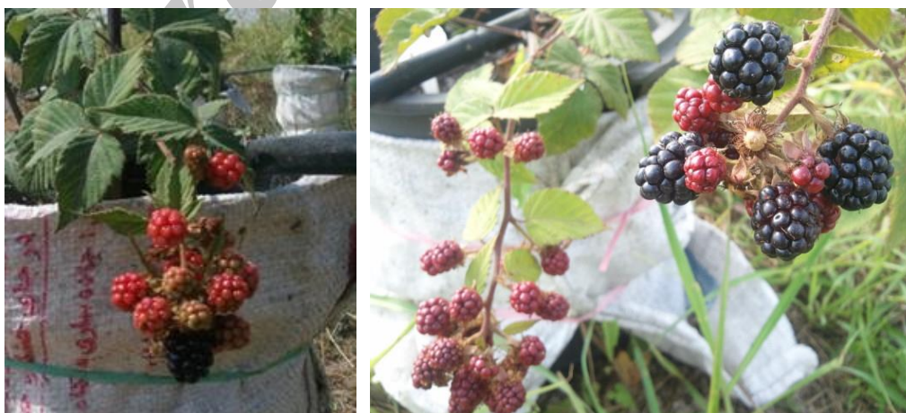
شکل ۲. تفاوت رنگ میوه پیش از رسیدن در دو نمونه تمشک سیاه بی‌خار شامل نمونه رامسر cvTLRahmadi5 (سمت راست) و نمونه ساری ۱۰ (سمت چپ)

در این بررسی برای ارزیابی فاصله همانندی‌ها و تفاوت‌های نژادگان‌های تمشک بی‌خار و همچنین گروه‌بندی آن‌ها از تجزیه خوشه‌ای (شکل ۳) استفاده شد. بنابر نتایج نمونه‌ها بر مبنای تفاوت معنی‌دار طول گل، نسبت میزان قند به اسید و شمار و وزن بذر نمونه‌های درون آن‌ها در دو دسته مجزا با ۱۰۰ درصد تفاوت قرار گرفتند، که دسته اول با میزان تفاوت حدود ۳۸ درصد به دو گروه و آن‌ها هم در فاصله کمتر از ۲۰ درصد به زیرگروه تقسیم شدند. دسته دوم شامل ۷ نژادگان بود که با میزان حدود ۱۰ درصد تفاوت به دو گروه و زیرگروه کوچک‌تر تقسیم شد.