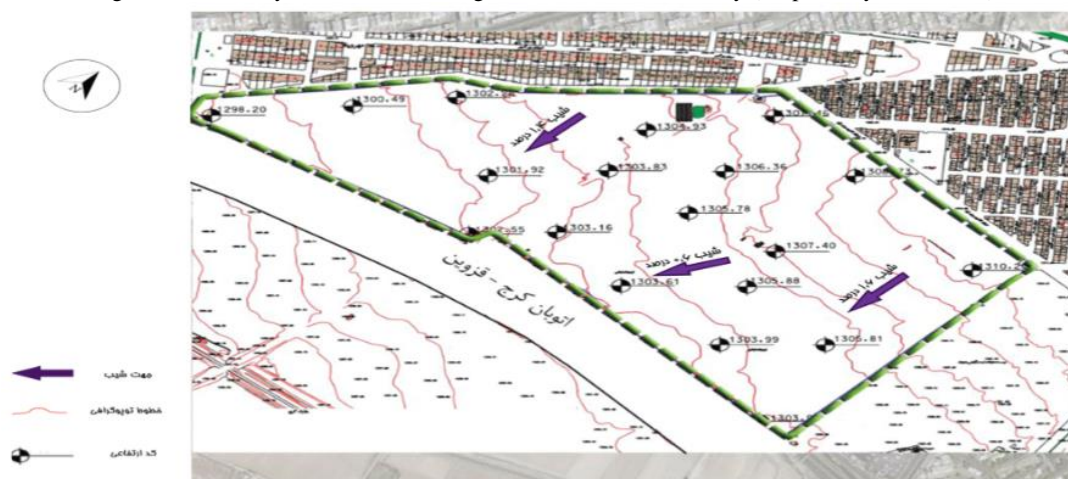
شکل ۳. نقشه توپوگرافی باغ نمونه کشوری دانشگاه تهران (تهیه شده توسط نویسندگان)