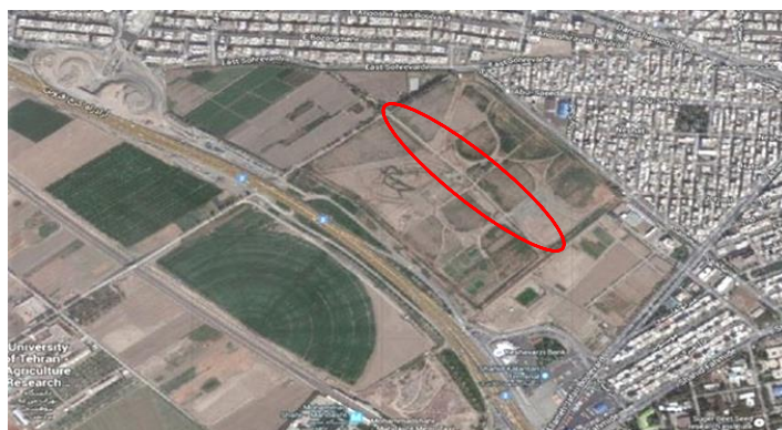
شکل ۵. محل قرارگیری سایت باغ ایرانی در باغ نمونه کشوری دانشگاه تهران (www.google earth.com)