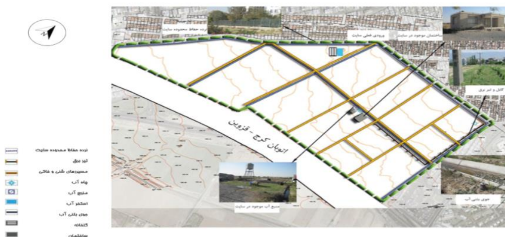
شکل ۴. نقشه دسترسی در مقیاس همسایگی باغ نمونه کشوری دانشگاه تهران (تهیه شده توسط نویسندگان)