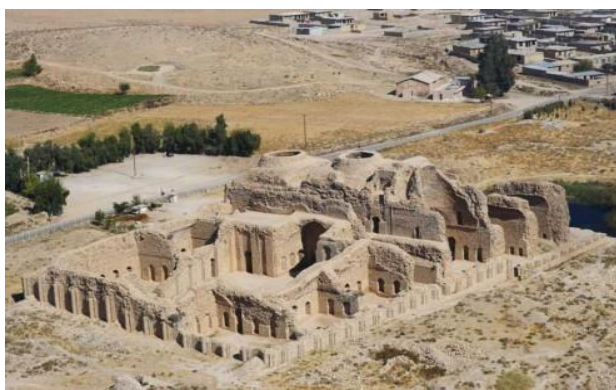
شکل ۷. کاخ فیروزآباد

Figure 6. Pasarghad garden (Hamzeh nejhad et al. , 2014)